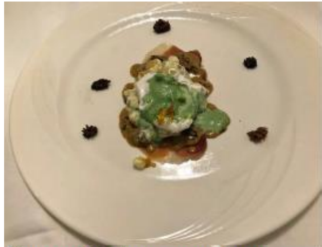
Hoeve-eitje, ham, morillesaus

8 stuks Hoeve-eitjes(Scharreleitjes) cress