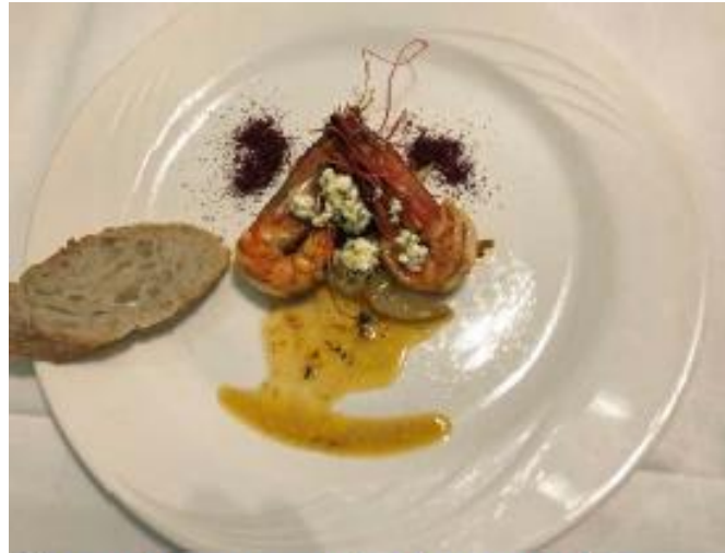
Garnalen, pernod, dragon, feta

180 ml Pernod 150 ml groentebouillon 70 gr boter olijfolie 20 gr dragon ½ theel. grof zeezout. 8 sneetjes witbrood