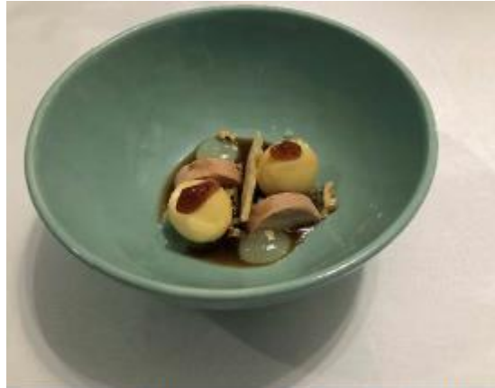
Bonbons Chaume, duivenbouillon, eendenlever