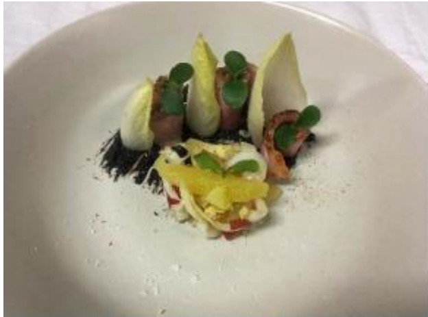
Eendenborst, witlof, truffel, sinaasappel

witlofsalade, leg een partje sinaasappel erop en werk af met blaadje cress.